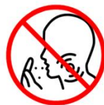
Mund und Nase beim Husten oder Niesen Abdecken. Beachten Sie die Hust- und Niesetikette