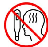
Gehen Sie bei grippeähnlichen Symptomen zum Arzt