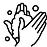
Waschen Sie Ihre Hände nach dem Husten oder Niesen