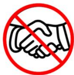
Verzichten Sie auf Umarmungen und Händeschütteln